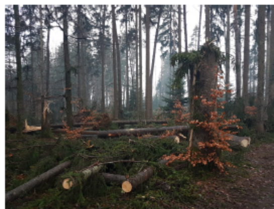
Interventions délicates et dangereuses dans un tel « mikado »

Les arbres renversés sont souvent dispersés aux quatre coins de la forêt. La mise en place de nombreux petits chantiers a pour conséquence un fort renchérissement de l'exploitation des bois. C'est pourquoi et dans certains cas, ces arbres sont abandonnés à la nature qui en fait le meilleur des usages. En effet, ces laissés-pour-compte contribueront à améliorer la biodiversité du milieu. En revanche, les propriétaires ne sont pas indemnisés pour ces coûts supplémentaires provoqués par la multitude de modestes chantiers ; ils doivent en plus faire face à un prix de vente souvent inférieur puisque certains bois sont cassés ou fendus.