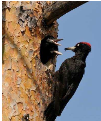
Pic noir

Le maintien de ces éléments implique une approche esthétique différente de la forêt. L'image du « propre en ordre » très présente jusqu'à la fin du siècle passé disparaît petit à petit. En effet, pour ses besoins énergétiques notamment, l'homme exploita souvent pratiquement jusqu'à la dernière brindille. Même litière et glands étaient récoltés favorisant ainsi une image de jardin forestier.