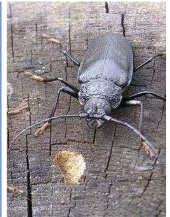
Longicorne : Ergate forgeron

Les tas de branches laissés en forêt après une exploitation suivent cette même logique de la promotion d'habitats forestiers. Contrairement à certaines croyances bien ancrées, ces restes de coupe ne véhiculent en aucun cas des maladies et ne contribuent pas au développement du bostryche 2 .